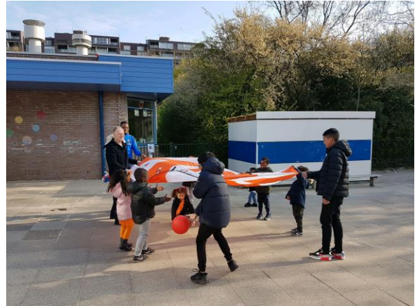
Koningspelen op het plein bij de kleuters.