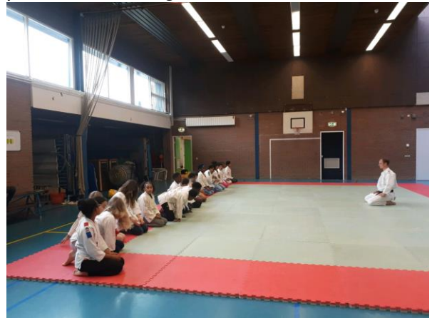
Groep 7A luistert geconcentreerd naar de sensei.

Zoals u weet hebben we extra bewegingslessen ingekocht in de vorm van judo. De judolessen slaan erg aan bij de leerlingen. Ze hebben er veel plezier in en doen goed hun best.