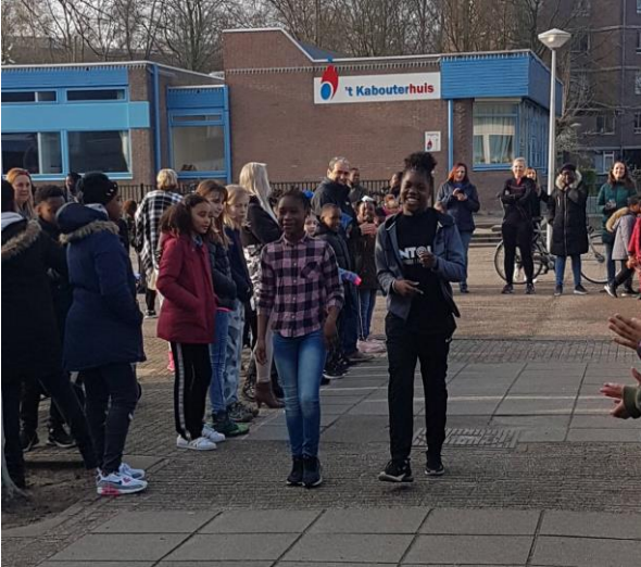
De catwalk tijdens de gezamenlijke opening.

De Grote Rekendag was een enorm succes. Na een feestelijke opening in de vorm van een modeshow, werd er in de hele school gerekend met verhoudingen.