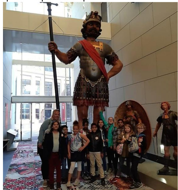
Groep 5 in de binnenstad met Taaltrip.

We zaten in de metro en we waren in groepjes verdeeld van 5 en 6 kinderen. In het centrum is een enorm weeshuis, naast het weeshuis is een museum en daar staat de grote reken reus. In het museum zit een foto van Johan Cruijff. We speelden op de binnenplaats met ze allen.