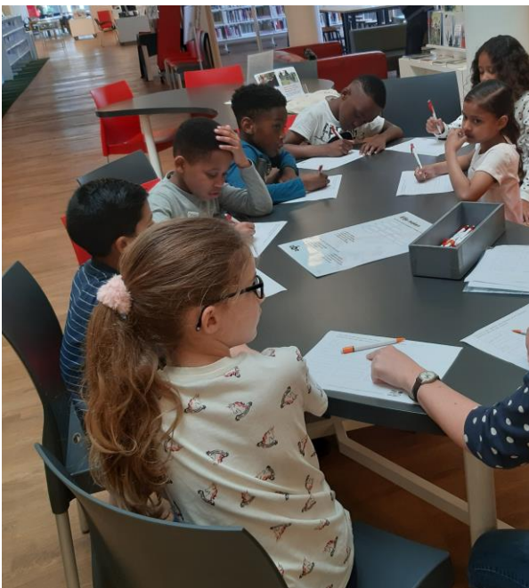
Groepen 4 bij de OBA

Maandagochtend 27 mei zijn de groepen 4 naar de OBA geweest. Zij hebben daar gespeeld met woorden en rijm. Gedichtjes bij het juiste plaatje gezocht, een elfje gemaakt over een dier en een eigen gedicht gemaakt met bestaande zinnen. Het was een leuke en leerzame ochtend.