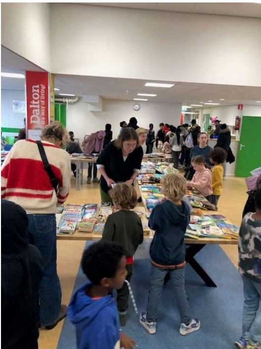
Op de boekenmarkt mochten alle kinderen een boek uitzoeken. Wat was er veel keuze!

In de aula stond de boekenmarkt. Het leek wel een echte winkel. Alle leerlingen hebben een boek meegekregen om te lezen in de vakantie en als laatst nog een lekker ijsje gegeten.