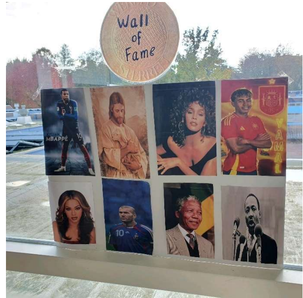
The Wall of Fame

Het was een ontdekkingstocht door de ruimte waar je kon leren over raketten en astronauten, vulkanen met echte uitbarstingen en lopen over de walk of fame.