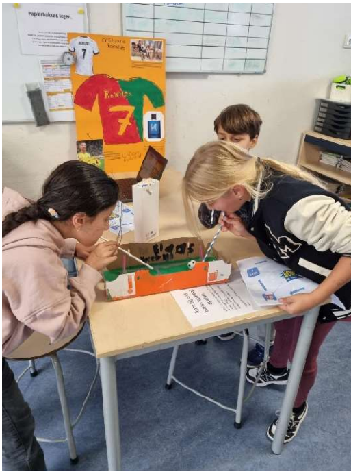
Het blaasvoetbalspel. Geheel zelf gemaakt natuurlijk!

In de aula stond de boekenmarkt. Het leek wel een echte winkel. Alle leerlingen hebben een boek meegekregen om te lezen in de vakantie en als laatst nog een lekker ijsje gegeten.