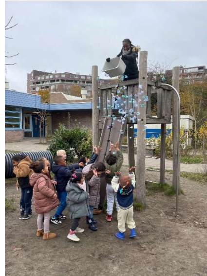
Rekenochtend bij de groepen 1-2